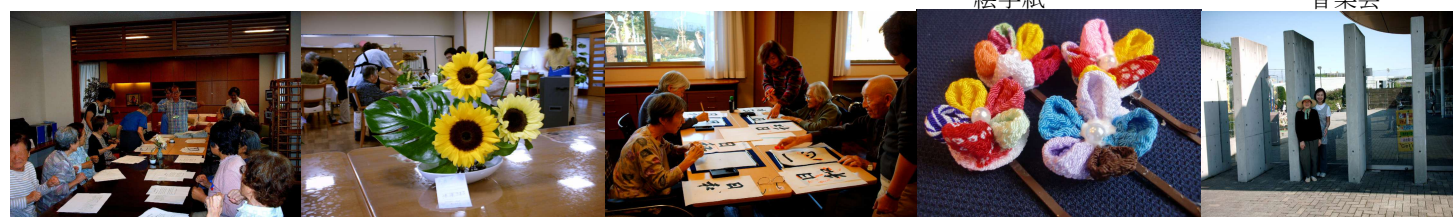
朗読の会 生け花 書道 手芸 散歩